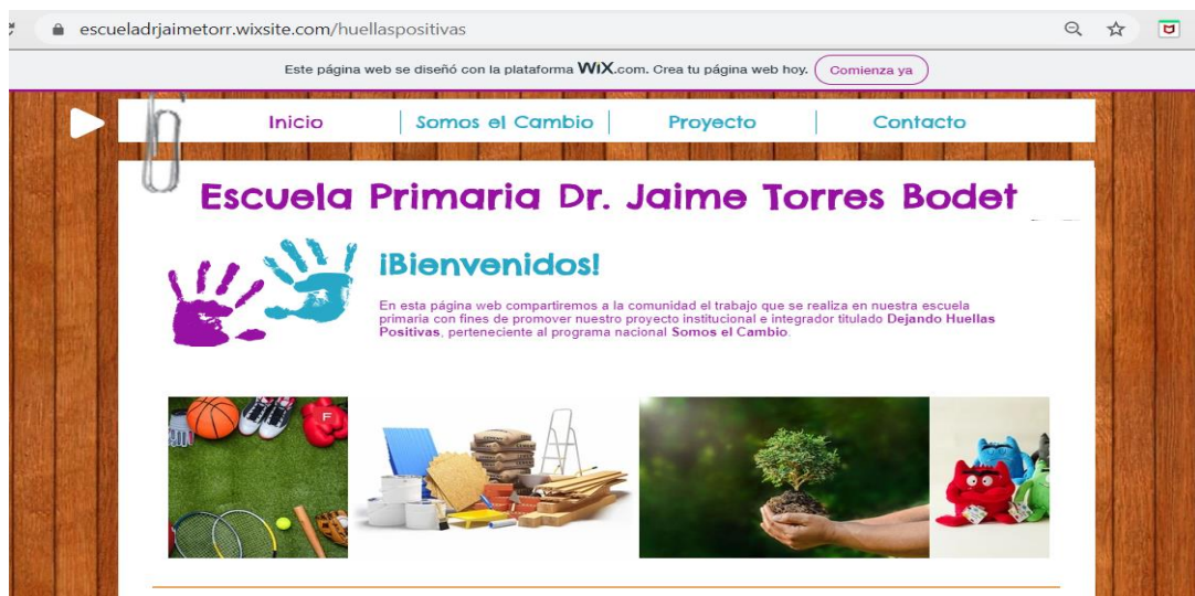
Imagen 10.2. Página web institucional

Continuar laborando en el proceso educativo de nuestros estudiantes, aún en estos casos, resulta imprescindible para su crecimiento y desarrollo de competencias. Las ventajas que permitieron el trabajo a distancia son las herramientas que facilitan el uso de la tecnología con fines didácticos; además, el diseño instruccional con el cual se organizaron las actividades y recursos acorde a las necesidades del grupo; el acceso a la conectividad, equipos y programas de apoyo desde casa; y las plataformas gratuitas que entablan comunicación asíncrona con la comunidad escolar; tal es el caso de la página web que diseñamos en Wix para compartir información relevante de los eventos que ocurren en la escuela (imagen 10.2).